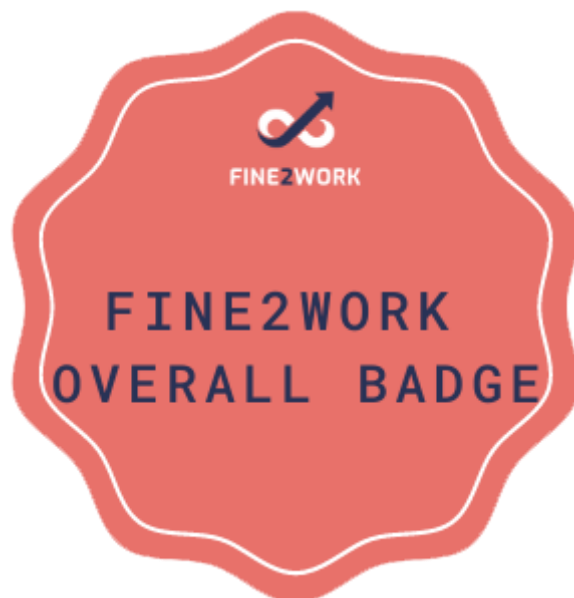
2. attēls. FINE2WORK vispārējais marķējums