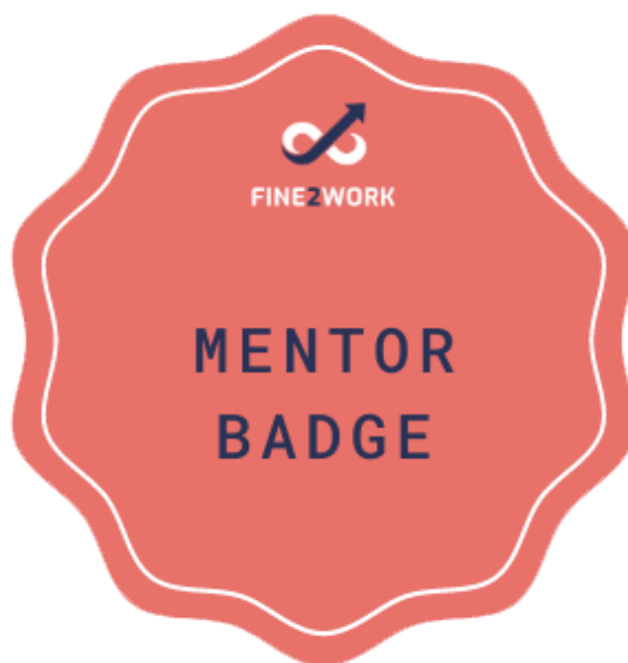
Фигура 3: FINE2WORK Менторска значка